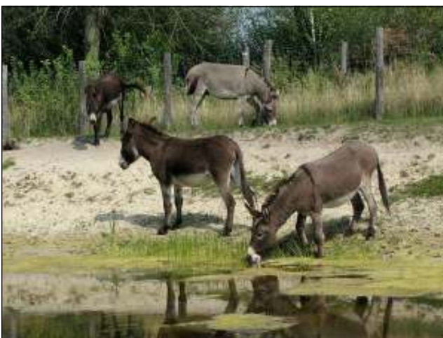
Foto 1: Een deel van de poelen is gegraven als veedrinkpoel voor de grazers die ingezet worden bij het natuurbeheer. Ezeltjes bij een poel in de Noordduinen.

De meeste van de poelen zijn relatief klein, en zijn behalve voor libellen ook voor amfibieën en waterplanten van groot belang. Het grootste deel ervan doet ook dienst als