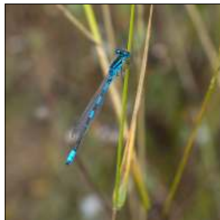
Gaffelwaterjuffer ( Coenagrion scitulum ), de soort van de dag bleek ondanks de late datum nog behoorlijk talrijk in de Houtsaegerduinen.