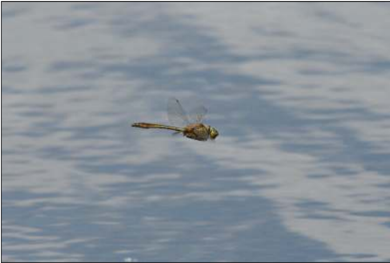
Foto 3: Smaragdlibel, die een tijdlang te zien was aan de poel van De Nachtegaal in De Panne.

Vlaanderen/België, en nauwelijks in West-Vlaanderen.