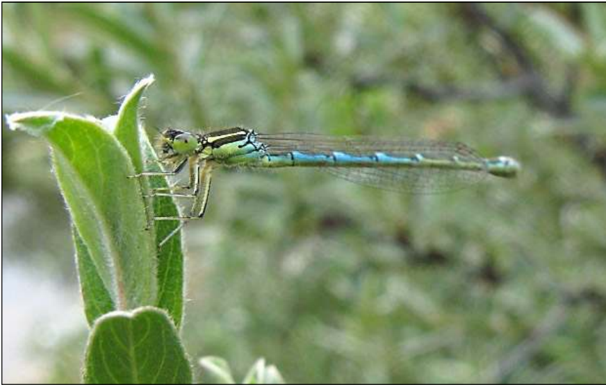
Foto 2. vrouwtje Gafelwaterjuffer; Ter Yde - Koksijde

oogjuffer, Zuidelijke oeverlibel, Zuidelijke keizerlibel, Zadellibel, Kanaaljuffer, Smaragdlibel en Noordse witsnuitlibel). Veel extra soorten vallen er voor 2009 niet te verwachten - Zuidelijke glazenmaker maakt wellicht het meeste kans.