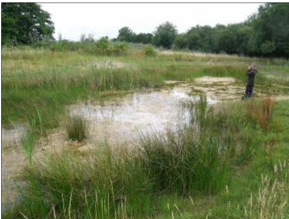
De Houtsaegerduinen, één van de poelen waar we Gaffelwaterjuffer vonden.

Ook het Lantaarntje ( Ischnura elegans ) met 10 exemplaren was gemakkelijk te zien tussen de regendruppels. Maar van de Azuurwaterjuffer ( Coenagrion puella ), die anders heel talrijk kan zijn, zagen we slechts één exemplaar. Verder noteerden we nog 3 Watersnuffels ( Enallagma cyathigerum ), 2 Kleine roodoogjuffers ( Erythromma viridulum ) en 1 Bruinrode heidelibel ( Sympetrum striolatum ).