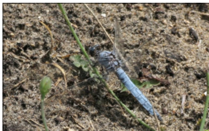
Foto 4 : De Zuidelijke oeverlibel in Koksijde

Kleine aantallen van deze soort werden bijna overal waargenomen (in de Atlas wordt slechts één hok vermeld!). Veel van de poelen zijn vrij klein en door de vertrapping van de oever(vegetatie) door vee behouden ze het pionierskarakter dat Tengere gras-