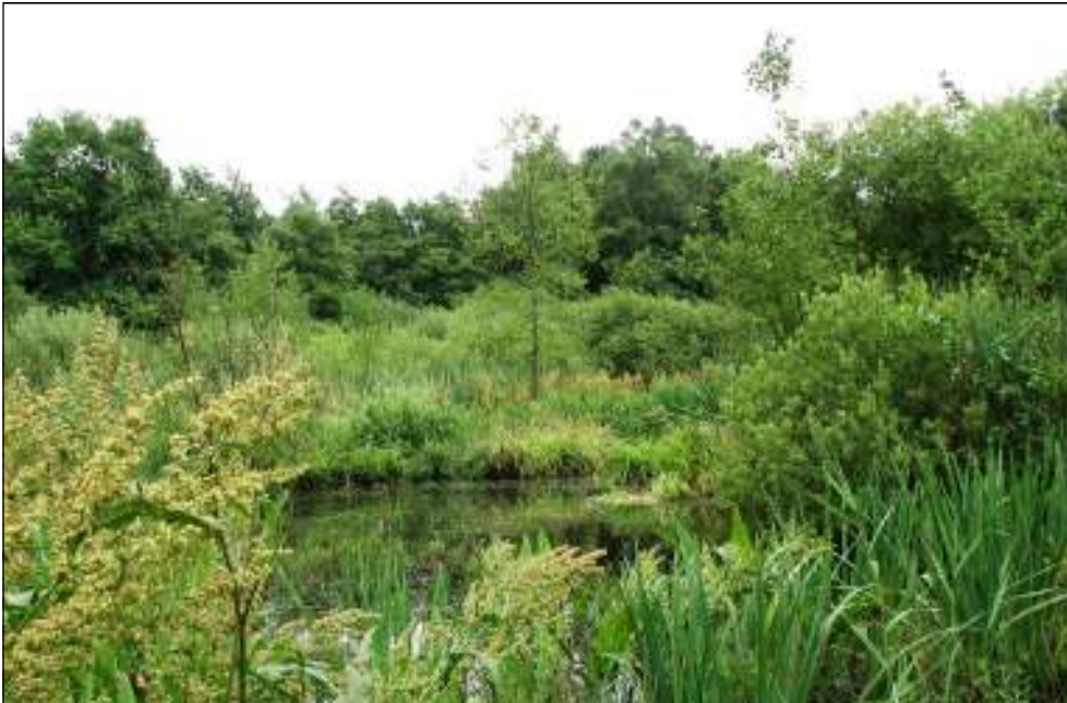
Foto 1. Panneweel.