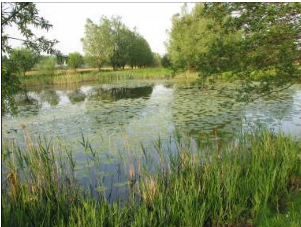
Foto 1. Kreekputten in het Panneweel.

Het Steengelaag is 31 ha groot en bestaat uit voormalige kleiputten, jong elzenbos, een oudere populierenaanplanting met heel wat dood hout, een grote vijver en een bloemrijk hoilandje. Die grote variatie staat borg voor een grote natuurrijkdom. De Saleghemkreek maakt deel uit van een resem kreekplassen op de grens van de vroegere gemeenten Sint-Gillis, Meerdonk en Vrasene en bestaan uit een kronkelig snoer van klei-