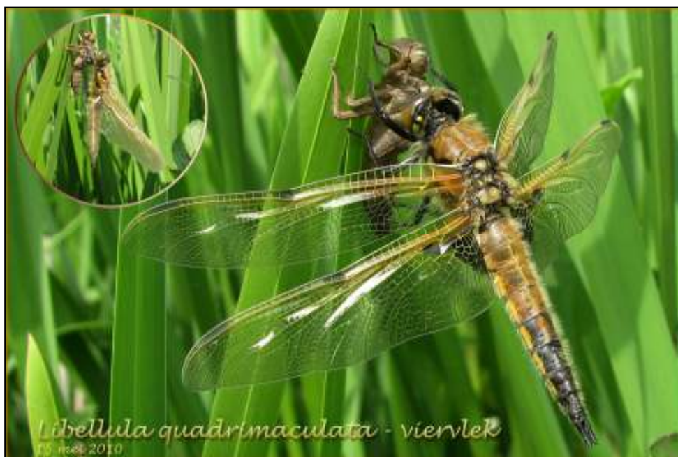
Foto 1: uitsluitende Viervlek op 15 mei.

We trokken met een kleine groep geïnteresseerden de velden in op zoek naar de eerste libellen en waterjuffers van het jaar. In een vochtig hooiland vlogen wat Lantaarntjes en Azuurwaterjuffers, wat verderop een enkele Vuurjuffer. Wat zoeken en ja hoor, daar de eerste Variabele waterjuffer en ook een eerste Grote roodoogjuffer.